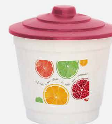
LIXEIRA PIA - NEW DECOR REF. 16893 EMB. 24 UNIDADES