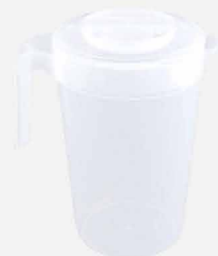
JARRA C/TP E TRAVA CRISTAL REF. 707 EMB. 12 UNIDADES