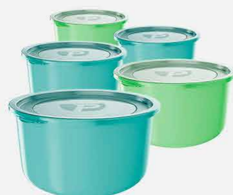
CAIXA REDONDA C/5 PÇS. REF. 729 EMB. 12 UNIDADES 1,2L