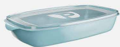
ORG. PRATIC MULTIUSO RETANG. REF. 801 EMB. 24 UNIDADES