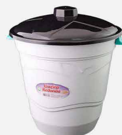
LIXEIRA REDONDA N.08 C/ TP REF. 657 EMB. 12 UNIDADES