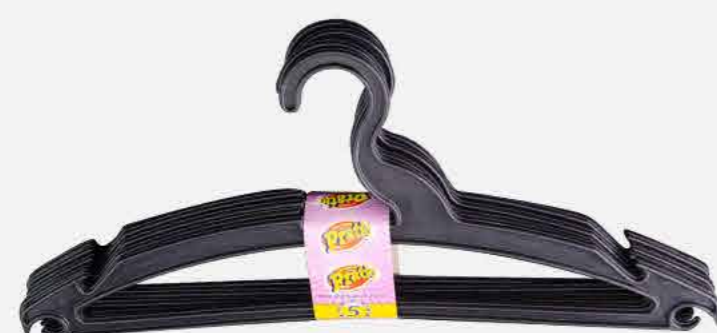
CABIDE PRETO REFORÇADO C/5 REF. 640 EMB. 32 UNIDADES