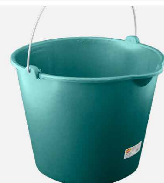
BALDE REFORÇADO Nº 12 REF. 538 EMB. 12 UNIDADES