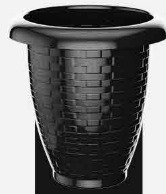
PRETO REF. 862