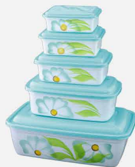
RETANGULAR 05 PÇS DEC. REF. 16710 EMB. 12 UNIDADES