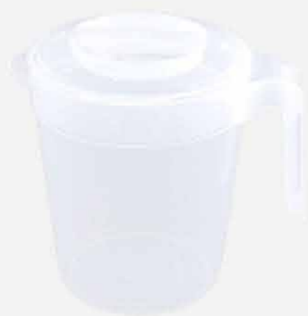
JARRA C/TP E TRAVA CRISTAL REF. 706 EMB. 12 UNIDADES