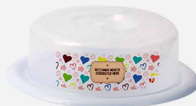
QUEIJEIRA - NEW DECOR