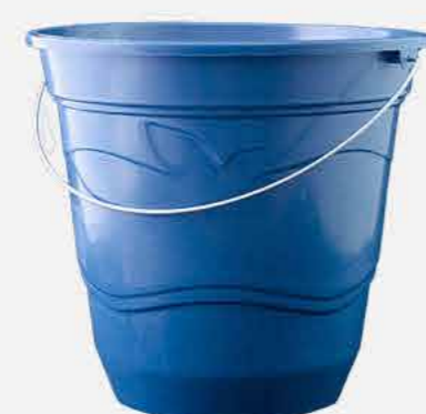
BALDE PEQUENO Nº 08 REF. 10069 EMB. 12 UNIDADES