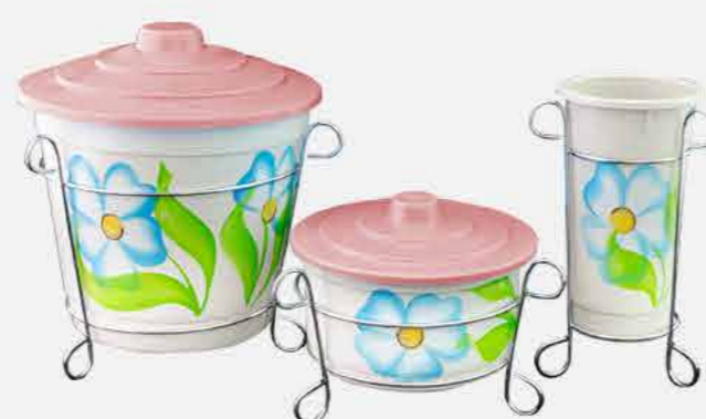
KIT PIA DEC.A MÃO C/ SUPORTE REF. 10790 EMB. 10 UNIDADES