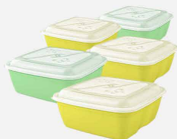
CAIXA QUADRADA C/5 PÇS. REF. 731 EMB. 12 UNIDADES 1,5L