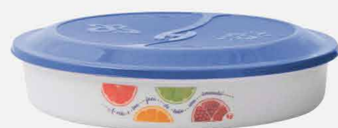
TORTEIRA - NEW DECOR REF. 10097 EMB. 24 UNIDADES