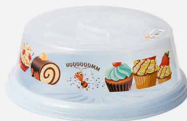
BOLEIRA EXPORTAÇÃO REF. 675 EMB. 12 UNIDADES