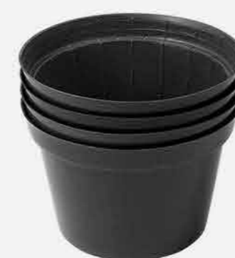
KIT VASOS C/4 PRETO Nº11 REF. 859 EMB. 24 UNIDADES