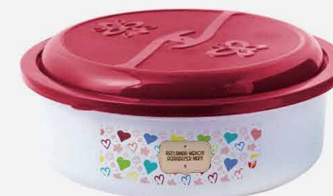
TOPA TUDO RED. NEW DECOR REF. 10085 EMB. 24 UNIDADES 3,5L