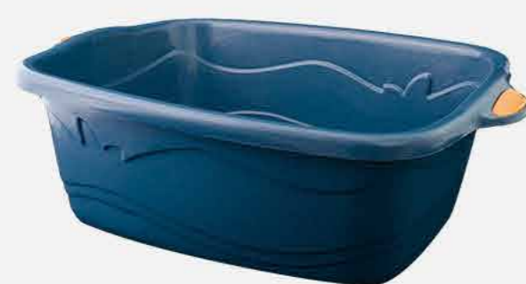
TACHO RETANGULAR Nº 11 REF. 17517 EMB. 12 UNIDADES