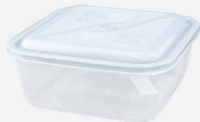
CAIXA VERSÁTIL QUADRADO REF. 16760 EMB. 24 UNIDADES