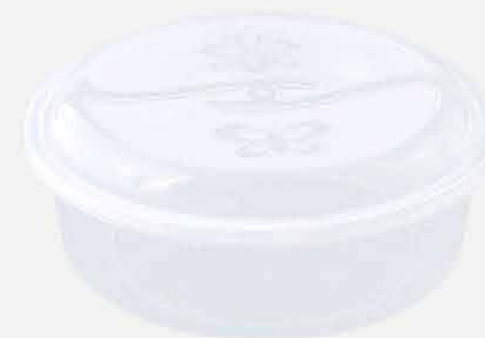
TOPA TUDO REDONDO CRISTAL REF. 710 EMB. 24 UNIDADES