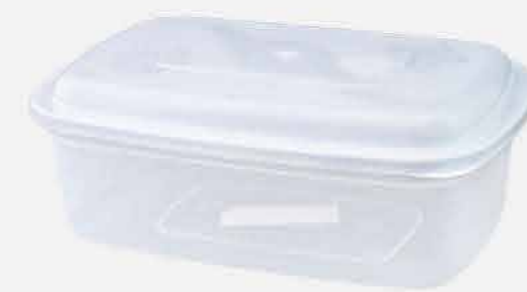
POTE RET. GRANDE AVULSO REF. 10049 EMB. 80 UNIDADES