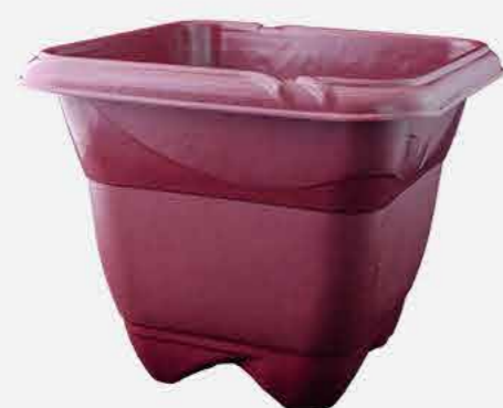
VASO COLOR Nº 22 REF. 16794 EMB. 24 UNIDADES