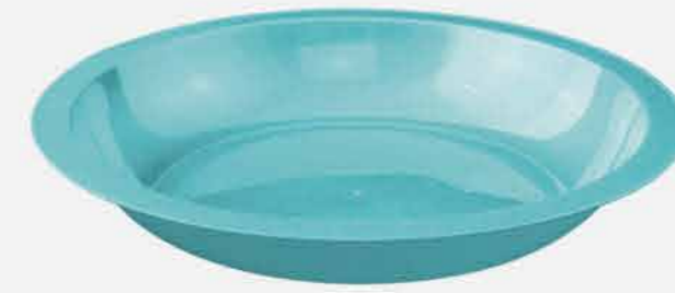
PRATO FUNDO REF. 596 EMB. 48 UNIDADES