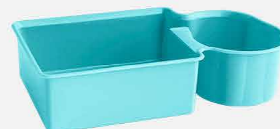
PORTA SABÃO REF. 861 EMB. 24 UNIDADES