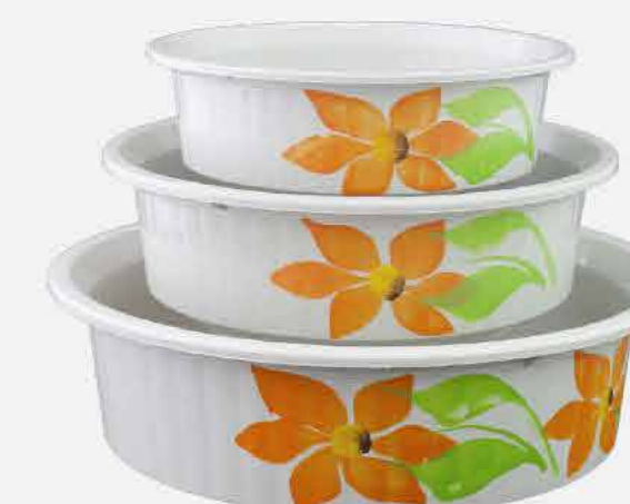
BACIAS P / M / G DEC. REF. 16798 EMB. 18 UNIDADES