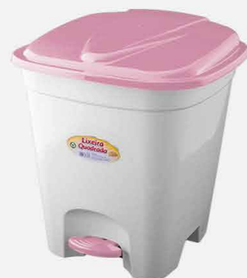
LIXEIRA QUADRADA N.14 C/ PEDAL REF. 658 EMB. 06 UNIDADES