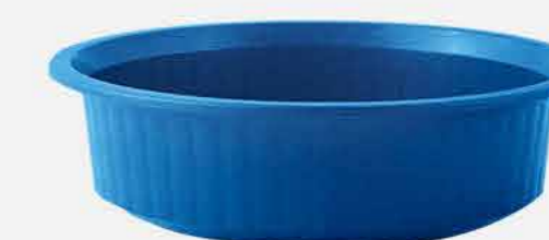
BACIA AVULSA P - COLOR REF. 16773 EMB. 48 UNIDADES