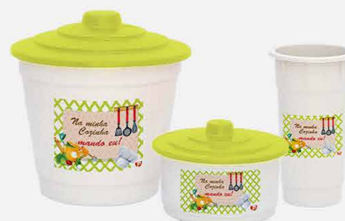
KIT PIA 03 PÇS - NEW DECOR REF. 16894 EMB. 12 UNIDADES