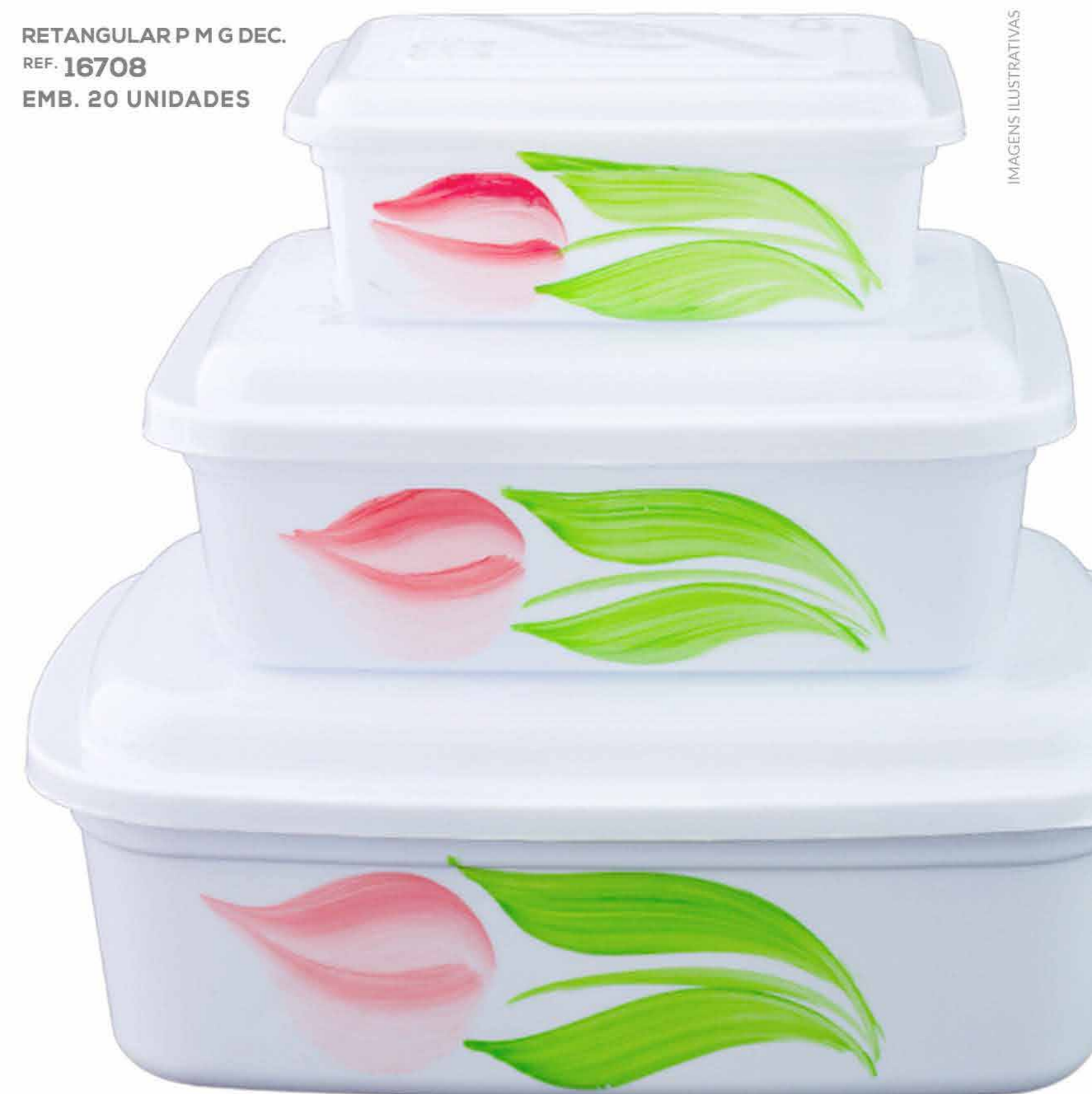
RETANGULAR P M G DEC. REF. 16708 EMB. 20 UNIDADES