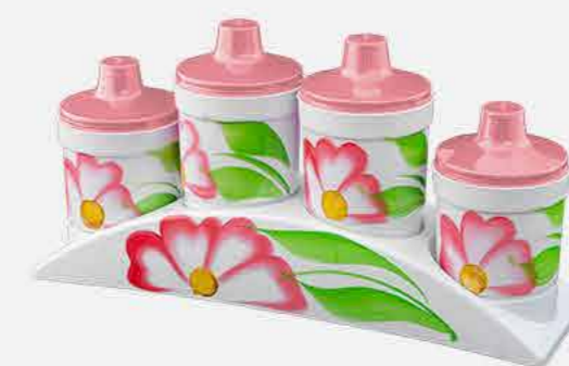
CONDIMENTO 04 PÇS DEC. A MÃO C/SUP.PLAS REF. 16818 EMB. 12 UNIDADES