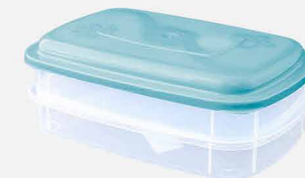
PORTA FRIOS 2 PÇS. REF. 16751 EMB. 24 UNIDADES