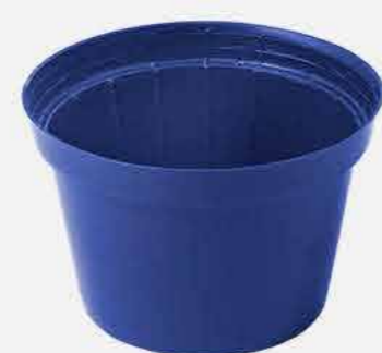
VASO REDONDO COLOR Nº11 REF. 856 EMB. 48 UNIDADES