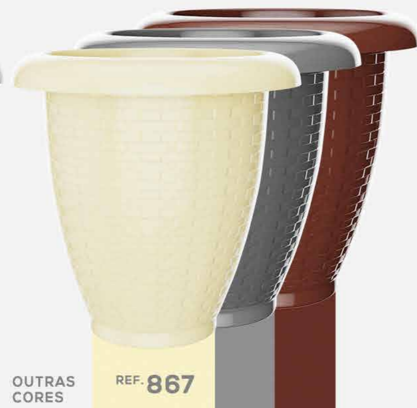
OUTRAS CORES REF. 867