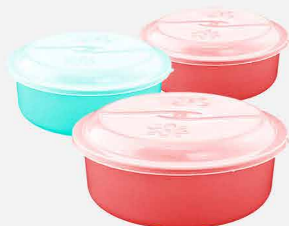
CAIXA REDONDA C/3 PÇS. REF. 726 EMB. 06 UNIDADES 3,5L