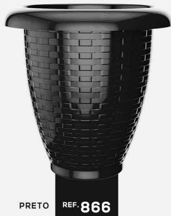
PRETO REF. 866