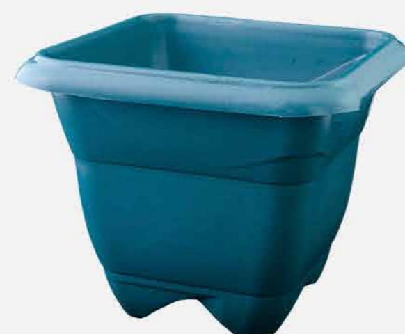
VASO COLOR Nº 28 REF. 16795 EMB. 12 UNIDADES