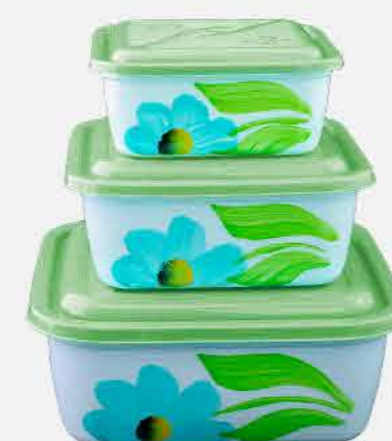
QUADRADO P / M / G DEC. REF. 16831 EMB. 20 UNIDADES