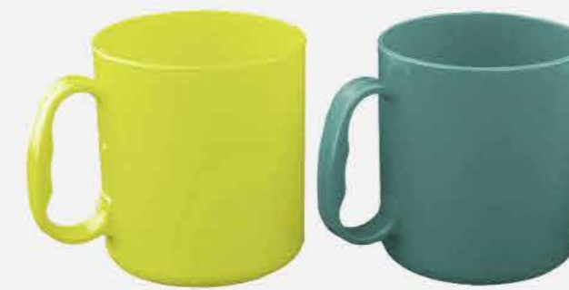
CANECA COLOR REF. 633 EMB. 36 UNIDADES