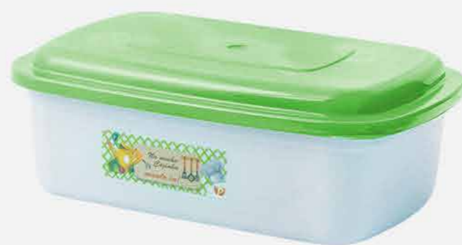
RETANGULAR GRANDE AVULSO ADES. REF. 16701 EMB. 80 UNIDADES 1,5L