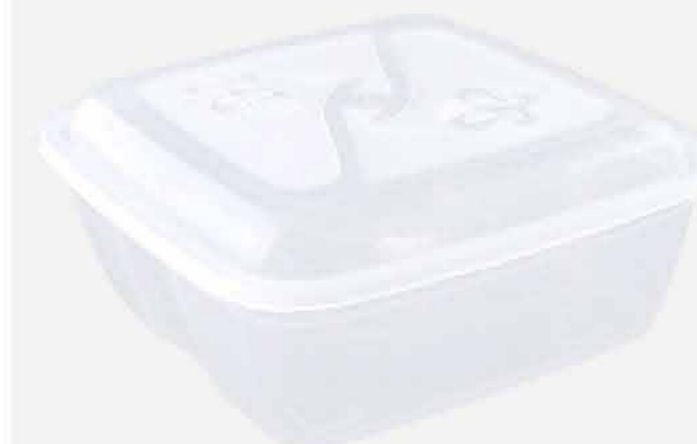
CX. VERSÁTIL QUADRADA CRISTAL REF. 708 EMB. 24 UNIDADES