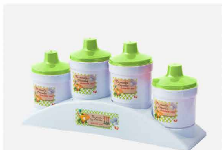
CONDIMENTO 04 PÇS C/ SUP.PLAST.- NEW DECOR