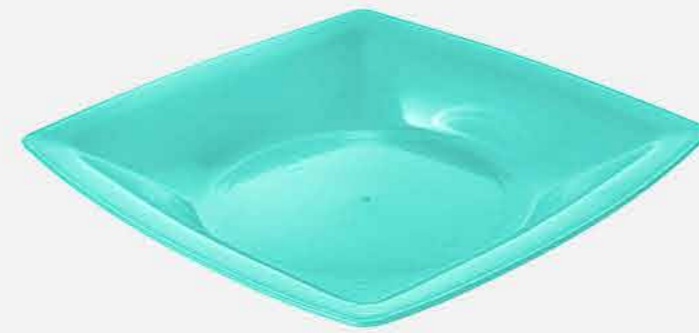
PRATO QUAD. FUNDO REF. 857 EMB. 48 UNIDADES