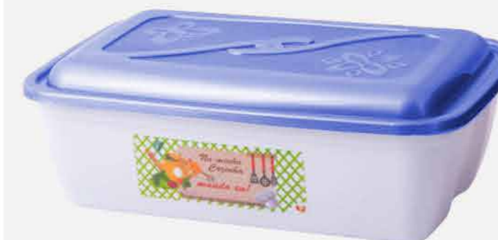
CAIXA VERSÁTIL RETANG. NEW DECOR REF. 10080 EMB. 24 UNIDADES 3,6L