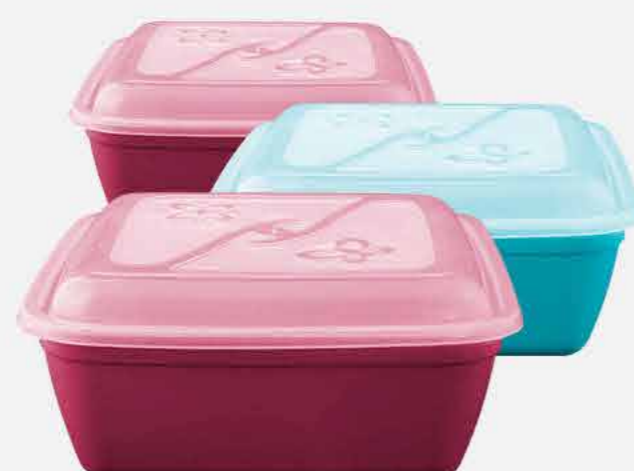
CAIXA QUADRADA C/3 PÇS. REF. 728 EMB. 06 UNIDADES 3,7L