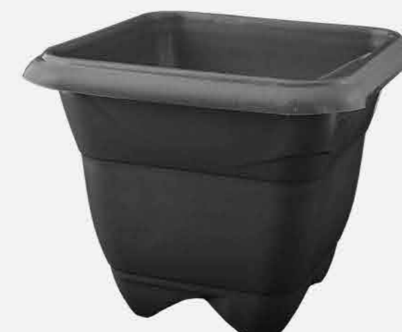
VASO PRETO Nº 28 REF. 16898 EMB. 12 UNIDADES