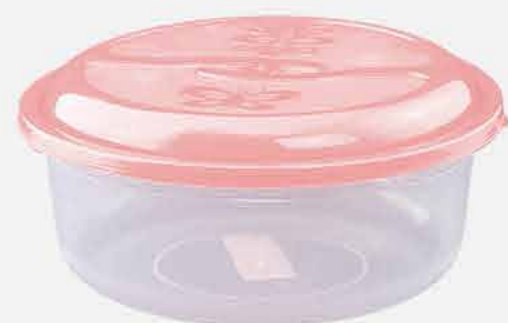
POTE REDONDO MAX REF. 16870 EMB. 24 UNIDADES