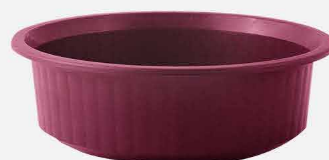
BACIA AVULSA G - COLOR REF. 16771 EMB. 48 UNIDADES