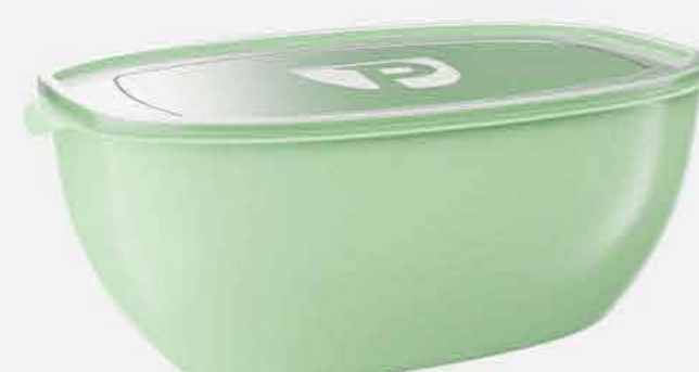
ORG. PRATIC MULTIUSO RETANG. REF. 779 EMB. 06 UNIDADES