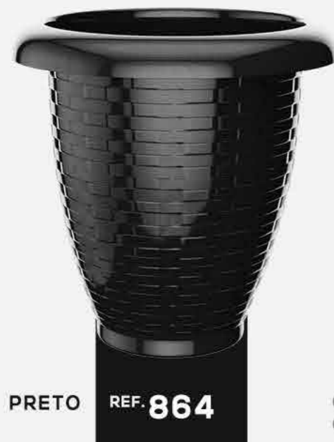
PRETO REF. 864