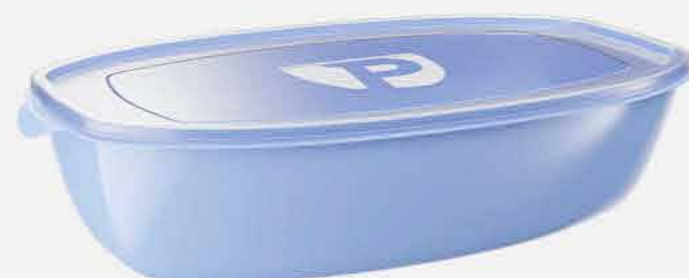
ORG. PRATIC MULTIUSO RETANG. REF. 778 EMB. 06 UNIDADES