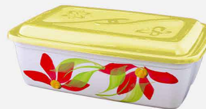
CAIXA VERSÁTIL RETANGULAR DEC. REF. 10006 EMB. 24 UNIDADES 3,6L