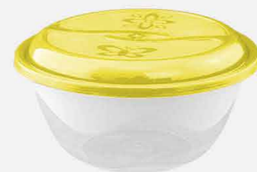
TIGELA C/ TAMPA REF. 10736 EMB. 24 UNIDADES