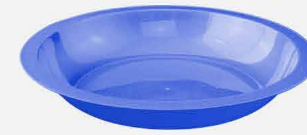
PRATO FUNDO ESCOLAR REF. 875 EMB. 48 UNIDADES