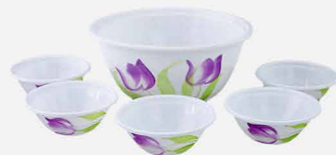
KIT SOBREMESA 6 PÇS DEC. A MÃO REF. 602 EMB. 12 UNIDADES