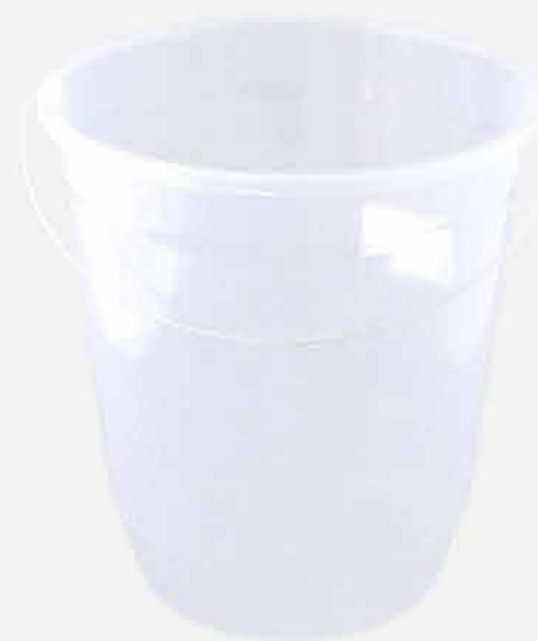
BALDE CRISTAL REF. 582 EMB. 12 UNIDADES