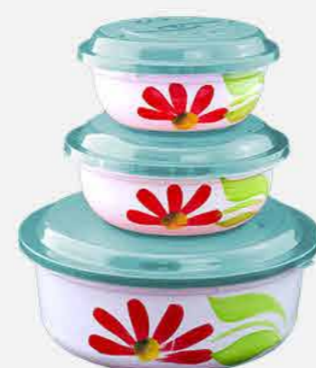
REDONDO P / M / G DEC. REF. 10087 EMB. 20 UNIDADES