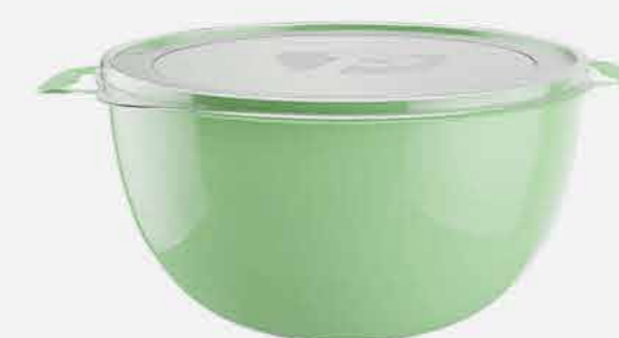
ORG. PRATIC MULTIUSO C/ TAMPA REF. 830 EMB. 12 UNIDADES