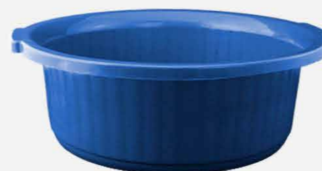
BACIA GIGANTE COLOR REF. 572 EMB. 12 UNIDADES