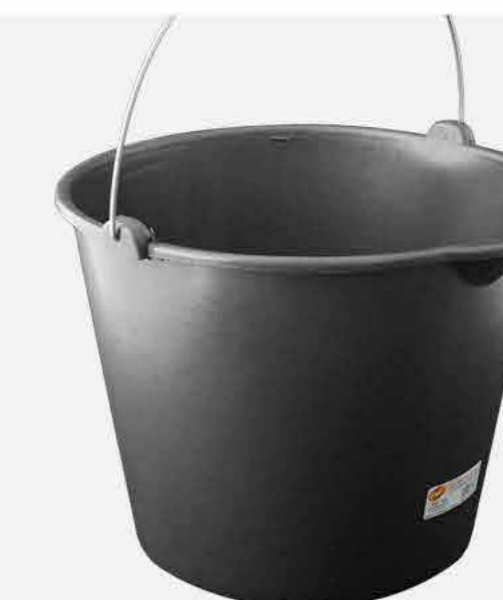
BALDE REFORÇADO Nº 12 REF. 17514 EMB. 12 UNIDADES