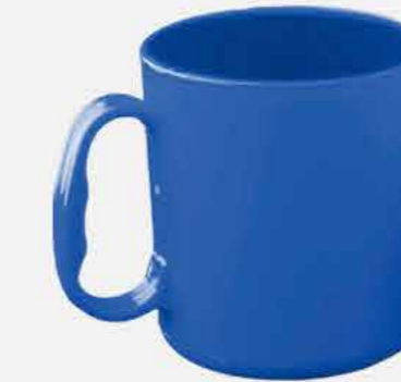
CANECA ESCOLAR REF. 876 EMB. 36 UNIDADES