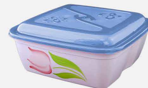
CAIXA VERSÁTIL QUADRADA DEC. REF. 16761 EMB. 24 UNIDADES 3,7L