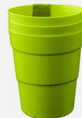
JOGO COPO 3 PÇS REF. 600 EMB. 40 UNIDADES