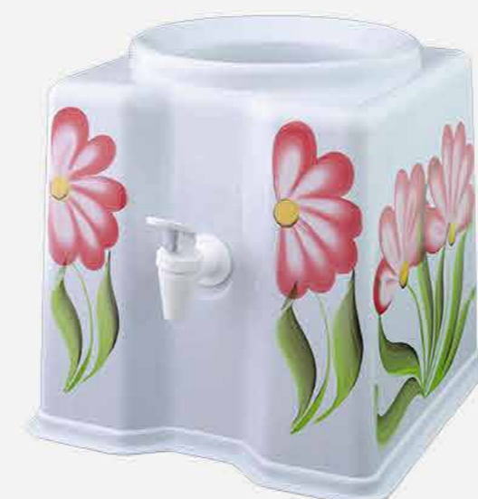
SUPORE P/ GALÃO ÁGUA QUAD. DEC. À MÃO REF. 10071 EMB. 06 UNIDADES