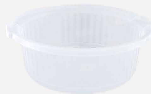
BACIA Nº 20 CRISTAL REF. 584 EMB. 12 UNIDADES