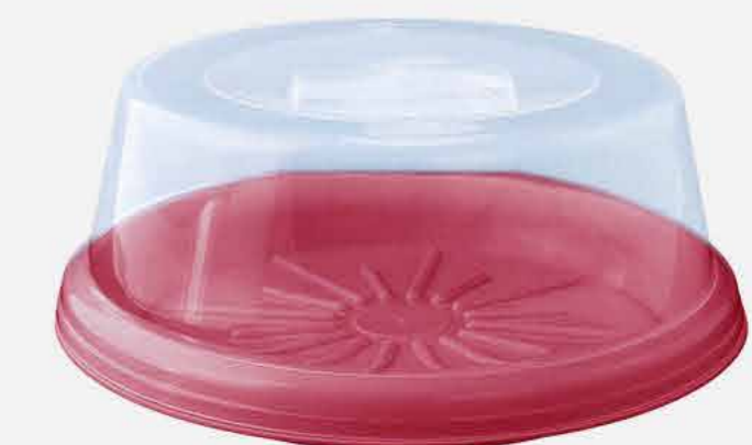
BOLEIRA REF. 661 EMB. 12 UNIDADES