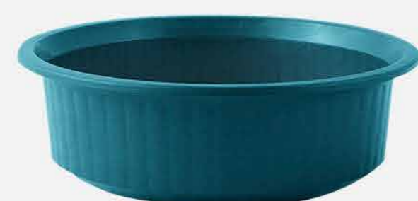
BACIA AVULSA M - COLOR REF. 16772 EMB. 48 UNIDADES