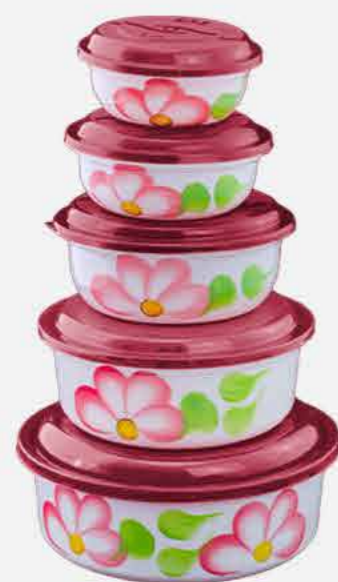
REDONDO 05 PÇS DEC. REF. 10093 EMB. 12 UNIDADES