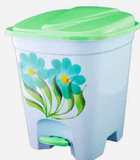
LIXEIRA QUAD. N.14 C/PEDAL DEC. A MAO REF. 634 EMB. 06 UNIDADES