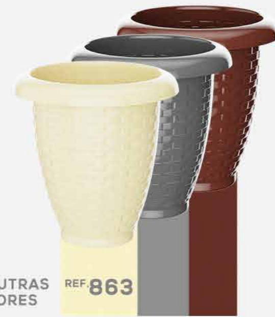
OUTRAS CORES REF. 863