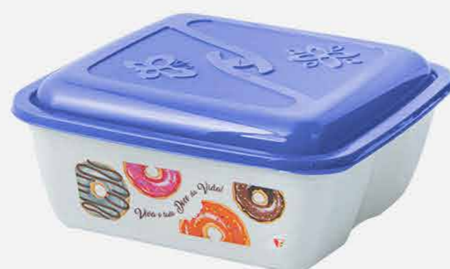
CAIXA VERSÁTIL QUAD. EXPORTAÇÃO REF. 613 EMB. 24 UNIDADES