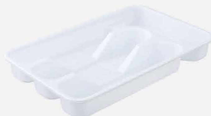
PORTA TALHERES 4 DIVISÓRIAS REF. 541 EMB. 18 UNIDADES