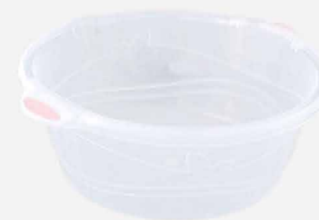
BACIA Nº 11 CRISTAL REF. 583 EMB. 12 UNIDADES