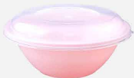
POTE SOBREMESA C/ TAMPA REF. 732 EMB. 60 UNIDADES