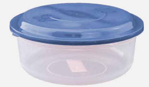
REDONDO GRANDE AVULSO REF. 10741 EMB. 80 UNIDADES