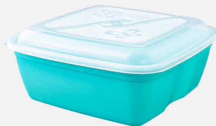
CAIXA VERSÁTIL QUAD. REF. 604 EMB. 24 UNIDADES