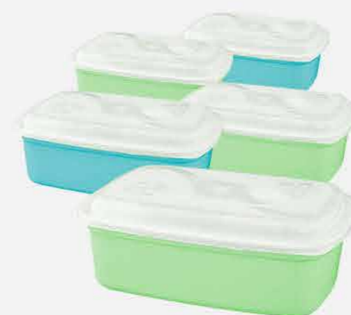
CAIXA RETANGULAR C/5 PÇS. REF. 730 EMB. 80 UNIDADES 1,5L