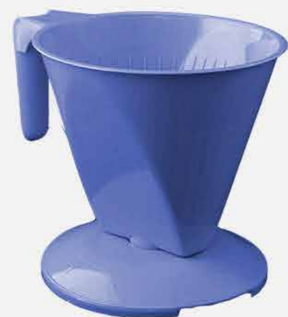
PORTA FILTRO CAFÉ TAM.103 REF. 16711 EMB. 48 UNIDADES