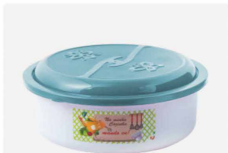
POTE REDONDO MAX NEW DECOR