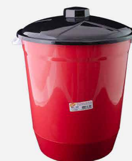
CESTO FECHADO N. 17 C/ TP REF. 659 EMB. 12 UNIDADES