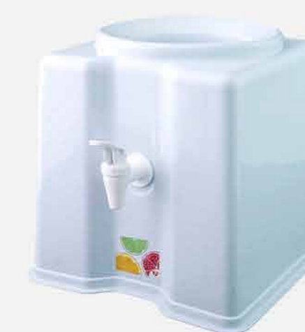
SUPORE P/ GALÃO ÁGUA QUAD. NEW DECOR REF. 17518 EMB. 06 UNIDADES