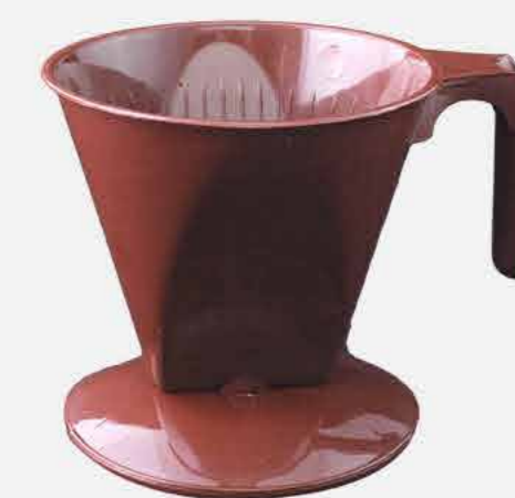
PORTA FILTRO CAFÉ TAM.103 MARROM REF. 16739 EMB. 48 UNIDADES