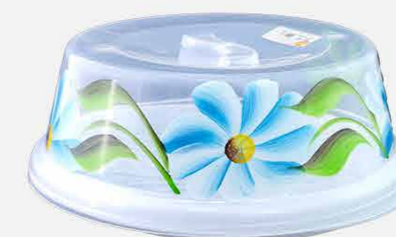
BOLEIRA DEC. A MAO REF. 663 EMB. 12 UNIDADES