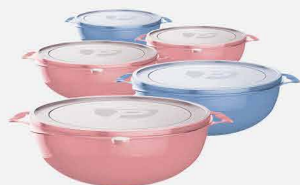
TOP PRATIC MULTIUSO C/5 PÇS. REF. 748 EMB. 06 UNIDADES 1L