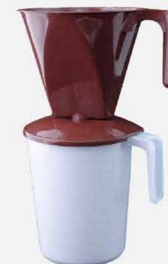
CONJ. CAFÉ 02 PÇS (JARRA +P.FILTRO) MARROM REF. 16741 EMB. 24 UNIDADES