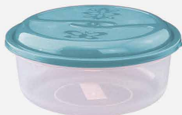
TOPA TUDO REDONDO REF. 16873 EMB. 24 UNIDADES