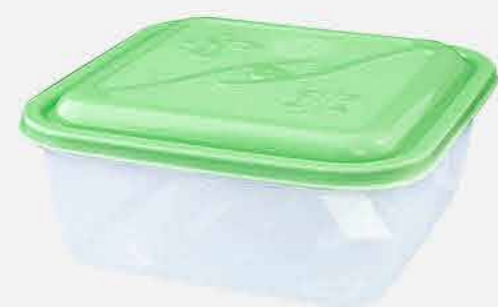
POTE QUADRADO G. AVULSO REF. 16763 EMB. 80 UNIDADES