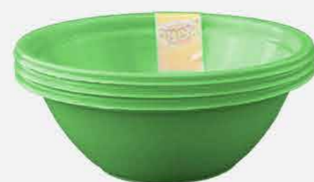
POTE SOBREMESA 3 PÇS REF. 598 EMB. 32 UNIDADES