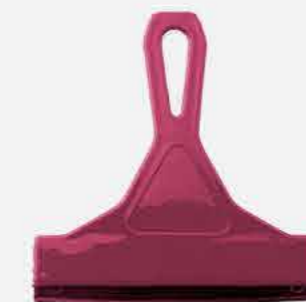
RODINHO P/ PIA S/ DECORAÇÃO REF. 10795 EMB. 36 UNIDADES