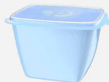
ORG. PRATIC MULTIUSO QUADRADO C/ TAMPA REF. 796 EMB. 24 UNIDADES