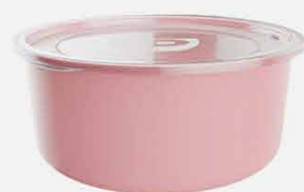
REDONDO AVULSO COLOR REF. 10798 EMB. 40 UNIDADES