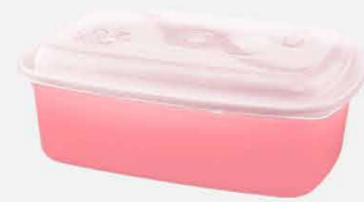
POTE RET. G. AVULSO COLOR REF. 573 EMB. 40 UNIDADES