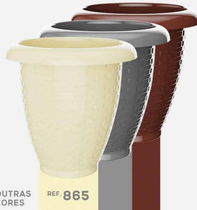
OUTRAS CORES REF. 865