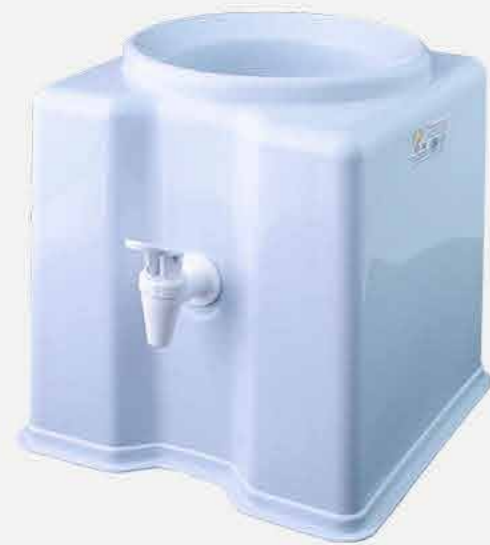
SUPORE P/ GALÃO ÁGUA QUAD. BRANCO REF. 560 EMB. 06 UNIDADES