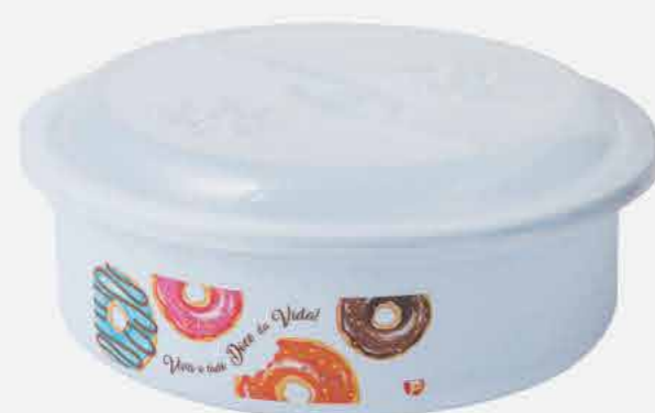
TOPA TUDO EXPORTAÇÃO REF. 611 EMB. 24 UNIDADES