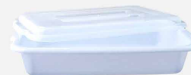
BANDEJA MULTI USO C/ TAMPA REF. 542 EMB. 12 UNIDADES