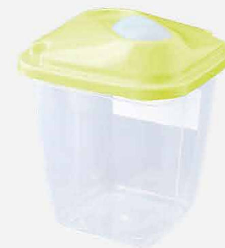
AÇUCAREIRO / FARINHEIRO 17510 EMB. 24 UNIDADES