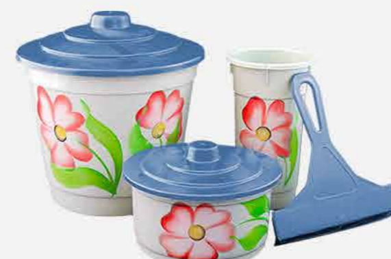
KIT PIA DEC.A MÃO C/RODINHO REF. 10752 EMB. 12 UNIDADES