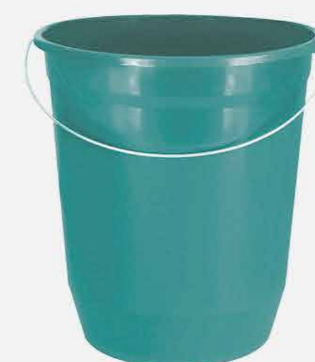
BALDE Nº 15 REF. 570 EMB. 12 UNIDADES