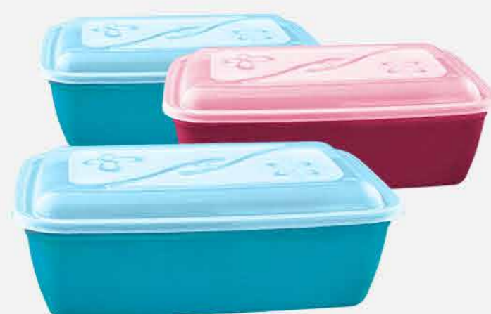
CAIXA RETANGULAR C/3 PÇS. REF. 727 EMB. 06 UNIDADES 3,6L