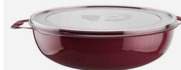
ORG. PRATIC MULTIUSO C/ TAMPA REF. 690 EMB. 06 UNIDADES