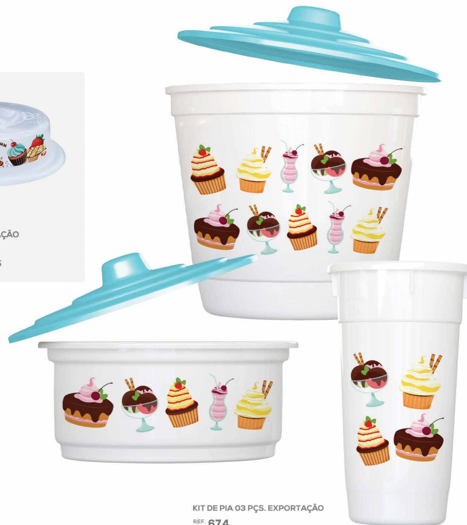
KIT DE PIA 03 PÇS. EXPORTAÇÃO REF. 674 EMB. 12 UNIDADES