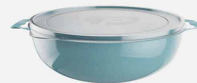
ORG. PRATIC MULTIUSO C/ TAMPA REF. 724 EMB. 24 UNIDADES