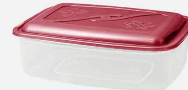
CAIXA VERSÁTIL RET. REF. 10749 EMB. 24 UNIDADES