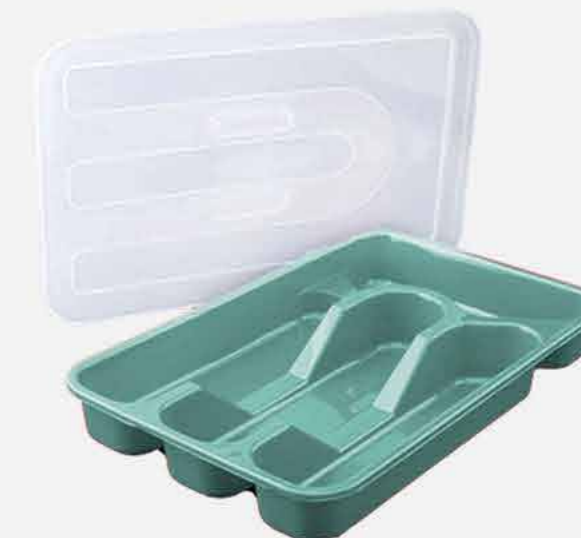
PORTA TALHERES 4 DIVISÓRIAS C/ TAMPA REF. 540 EMB. 12 UNIDADES