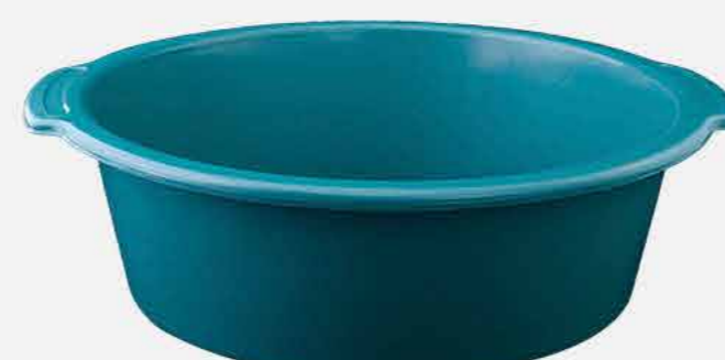
BACIA AVULSA Nº 07 - COLOR REF. 17506 EMB. 24 UNIDADES