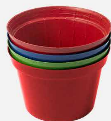
KIT VASOS C/4 COLOR Nº11 REF. 860 EMB. 24 UNIDADES