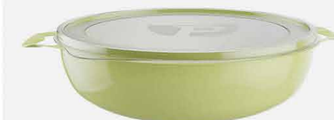
ORG. PRATIC MULTIUSO C/ TAMPA REF. 829 EMB. 12 UNIDADES