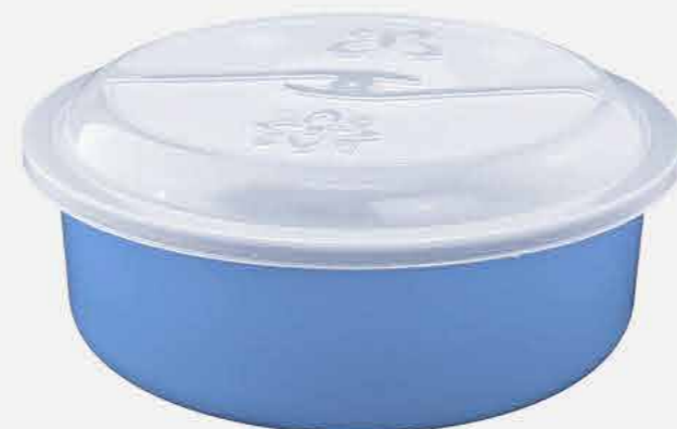
TOPA TUDO TROPICAL REF. 605 EMB. 24 UNIDADES