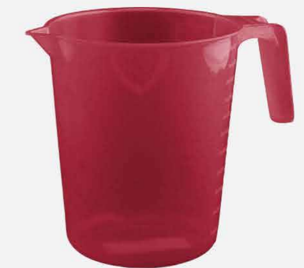
JARRA REF. 10799 EMB. 24 UNIDADES