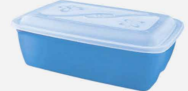
CAIXA VERSÁTIL RET. REF. 603 EMB. 24 UNIDADES