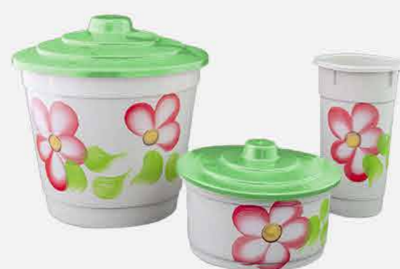
KIT PIA DEC. A MÃO REF. 10773 EMB. 12 UNIDADES