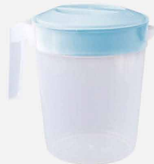
JARRA C/TP E TRAVA REF. 682 EMB. 12 UNIDADES