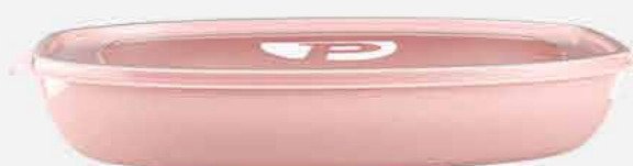
ORG. PRATIC MULTIUSO RETANG. REF. 777 EMB. 06 UNIDADES