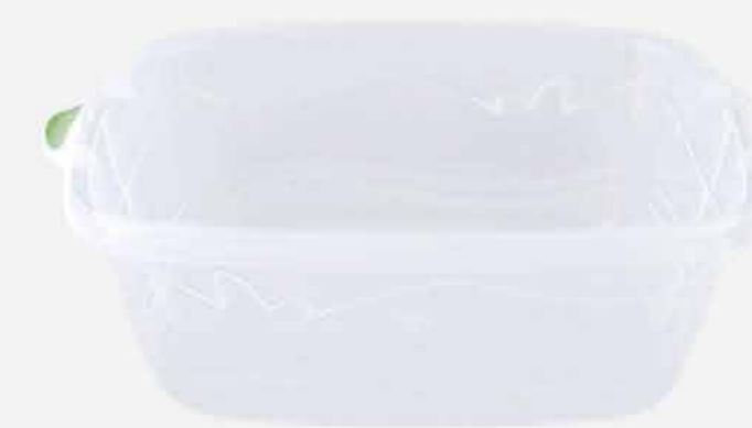
TACHO Nº. 11 CRISTAL REF. 586 EMB. 12 UNIDADES