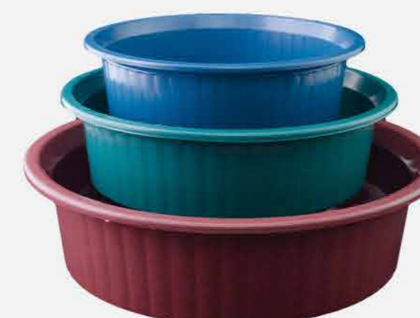
BACIAS P M G COLOR REF. 16769 EMB. 18 UNIDADES