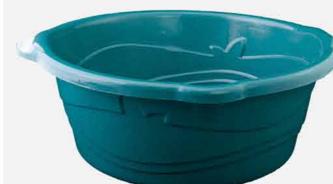
BACIA Nº 11 REF. 17516 EMB. 12 UNIDADES