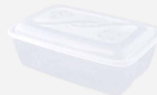
CX. RETANGULAR CRISTAL REF. 709 EMB. 24 UNIDADES