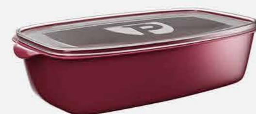
ORG. PRATIC MULTIUSO RETANG. REF. 802 EMB. 24 UNIDADES