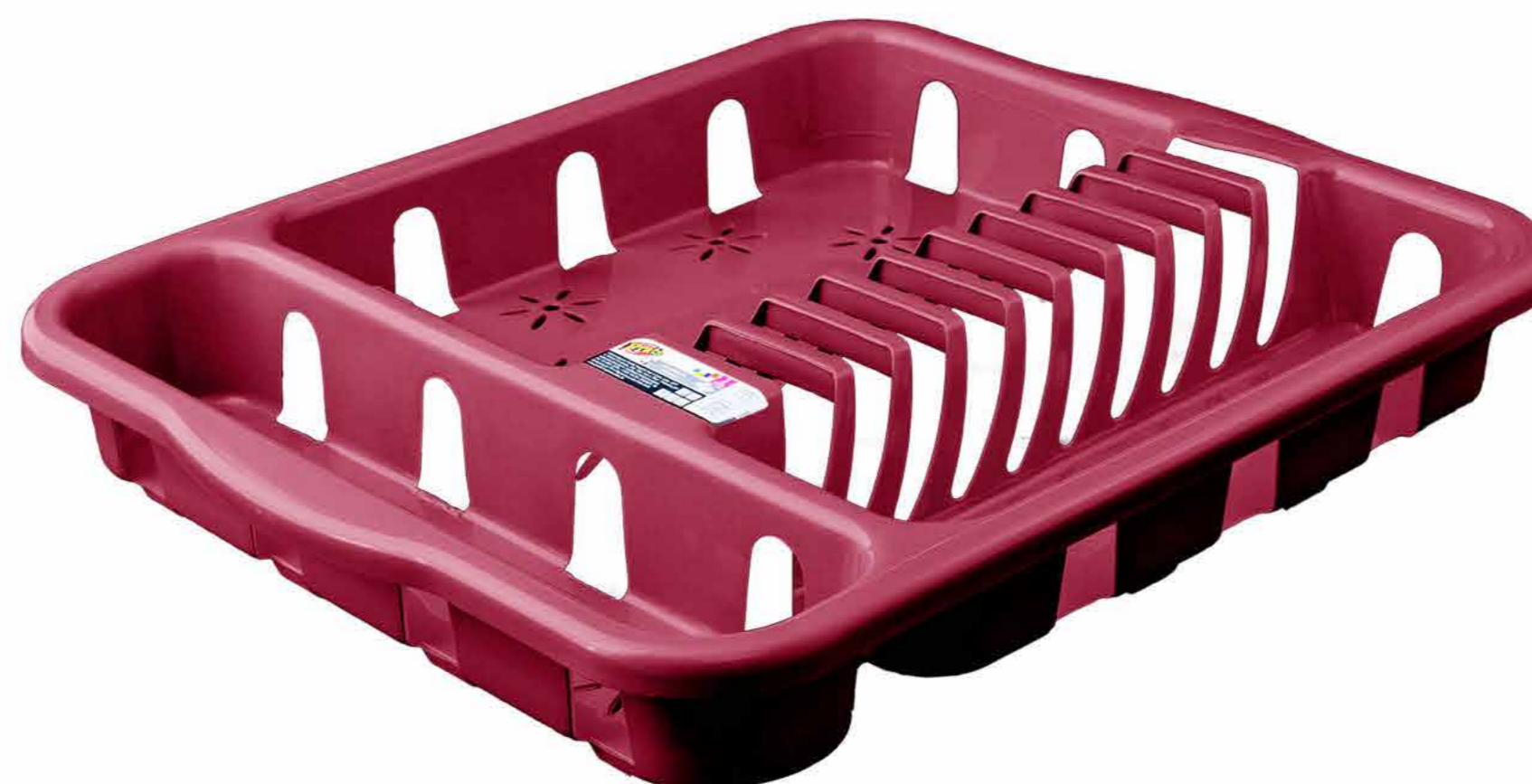
ESCORREDOR DE PRATO REF. 565 EMB. 12 UNIDADES