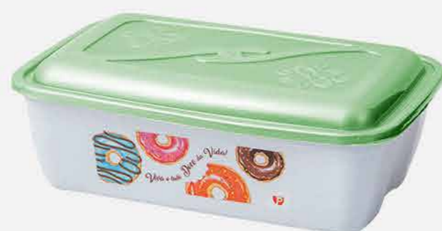
CAIXA VERSÁTIL RET. EXPORTAÇÃO REF. 612 EMB. 24 UNIDADES