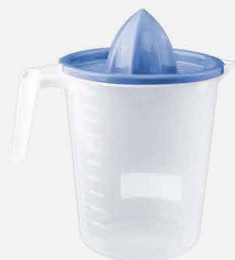
JARRA C/ ESPREMEDOR REF. 705 EMB. 24 UNIDADES