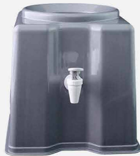
SUPORE P/ GALÃO ÁGUA QUAD. COLOR REF. 10070 EMB. 06 UNIDADES