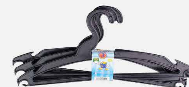
CABIDE PRETO REFORÇADO C/3 REF. 639 EMB. 56 UNIDADES