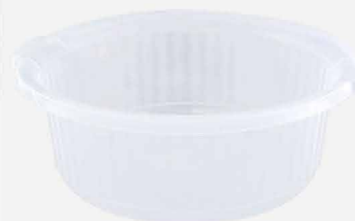
BACIA GIGANTE CRISTAL REF. 585 EMB. 12 UNIDADES