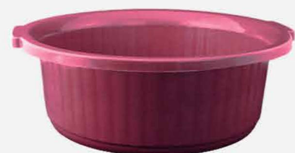
BACIA Nº 20 COLOR REF. 571 EMB. 12 UNIDADES