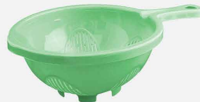
LAVA TUDO C/ CABO REF. 564 EMB. 24 UNIDADES