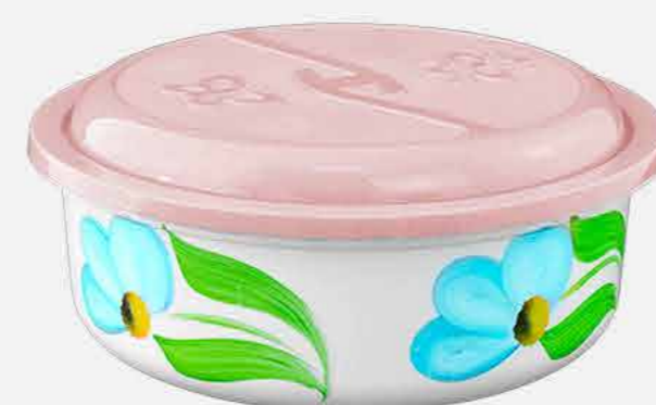
TOPA TUDO REDONDO DEC. REF. 16874 EMB. 24 UNIDADES 3,5L