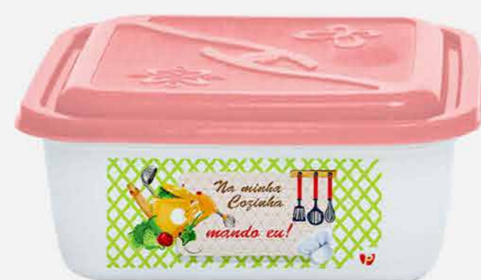
CAIXA VERSÁTIL QUAD. NEW DECOR REF. 10081 EMB. 24 UNIDADES 3,7L