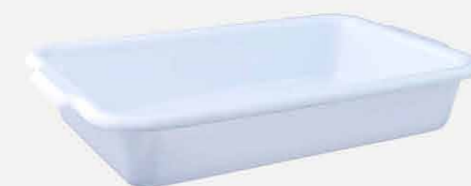
BANDEJA MULTI USO REF. 543 EMB. 12 UNIDADES