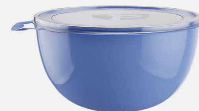
ORG. PRATIC MULTIUSO C/ TAMPA REF. 691 EMB. 06 UNIDADES