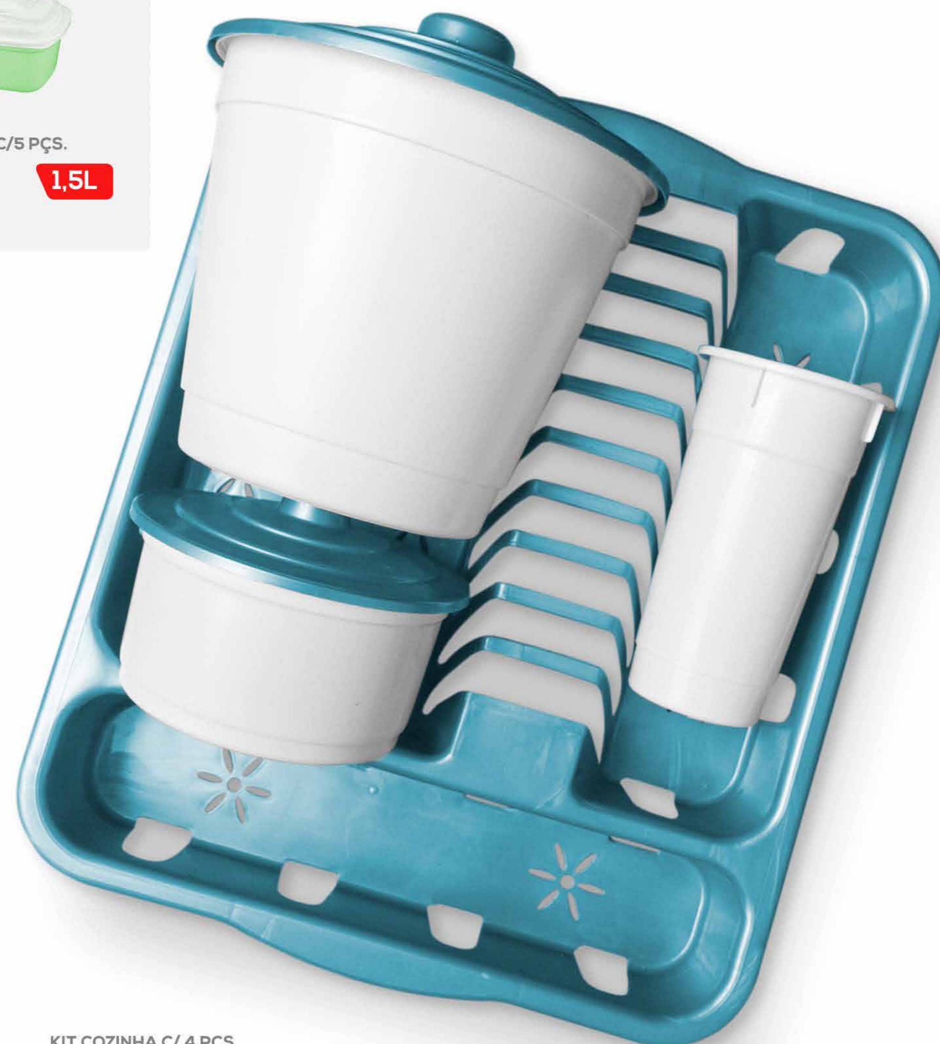
KIT COZINHA C/ 4 PÇS. REF. 874 EMB. 8 UNIDADES