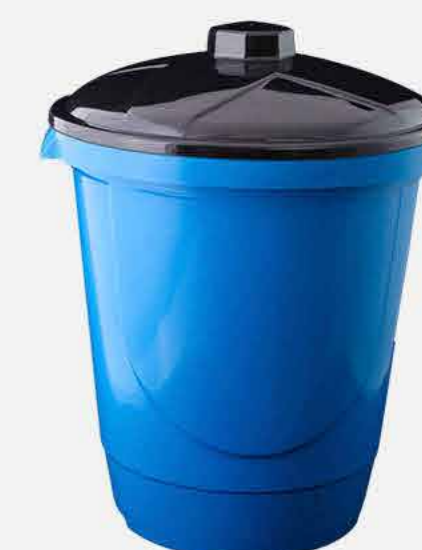
CESTO FECHADO N. 25 C/ TP REF. 660 EMB. 06 UNIDADES