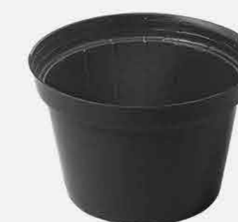
VASO REDONDO PRETO Nº11 REF. 855 EMB. 48 UNIDADES