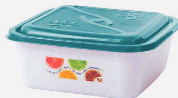
POTE QUAD. G AVULSO ADES. REF. 16764 EMB. 80 UNIDADES 1,5L