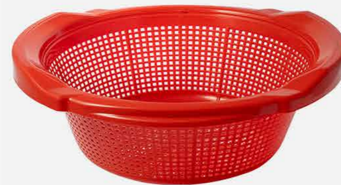
LAVA TUDO S/ CABO REF. 858 EMB. 24 UNIDADES