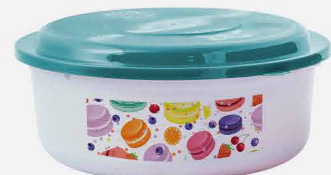
REDONDO GRANDE AVULSO ADES. REF. 10740 EMB. 80 UNIDADES 1,5L