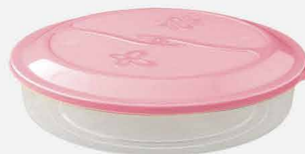
TORTEIRA REF. 16747 EMB. 24 UNIDADES