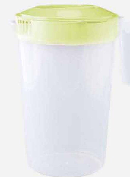
JARRA C/TP E TRAVA REF. 683 EMB. 12 UNIDADES